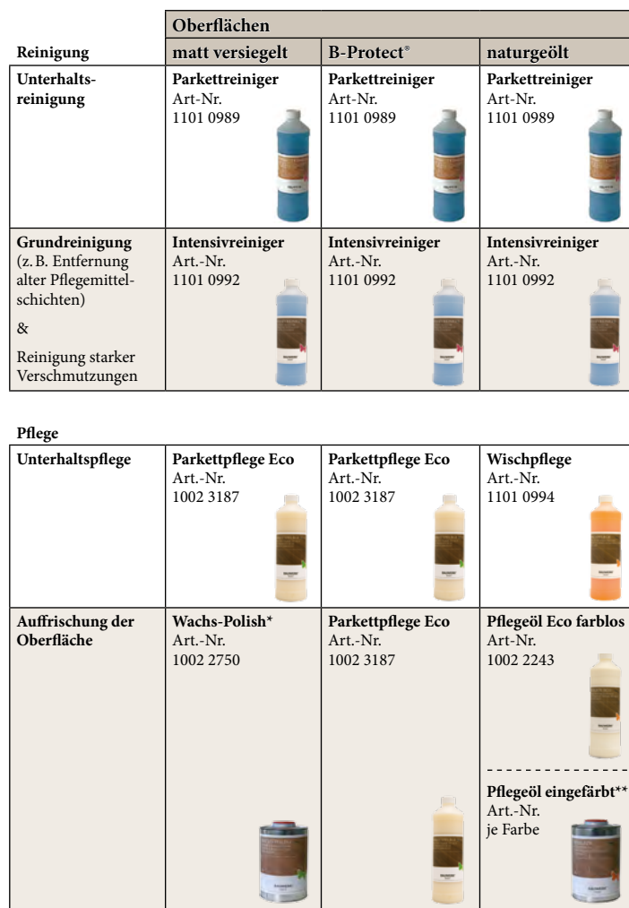
Tabelle Reinigungs- & Pflegeprodukte

* muss maschinell aufpoliert werden | ** bei eingefärbten Produkten